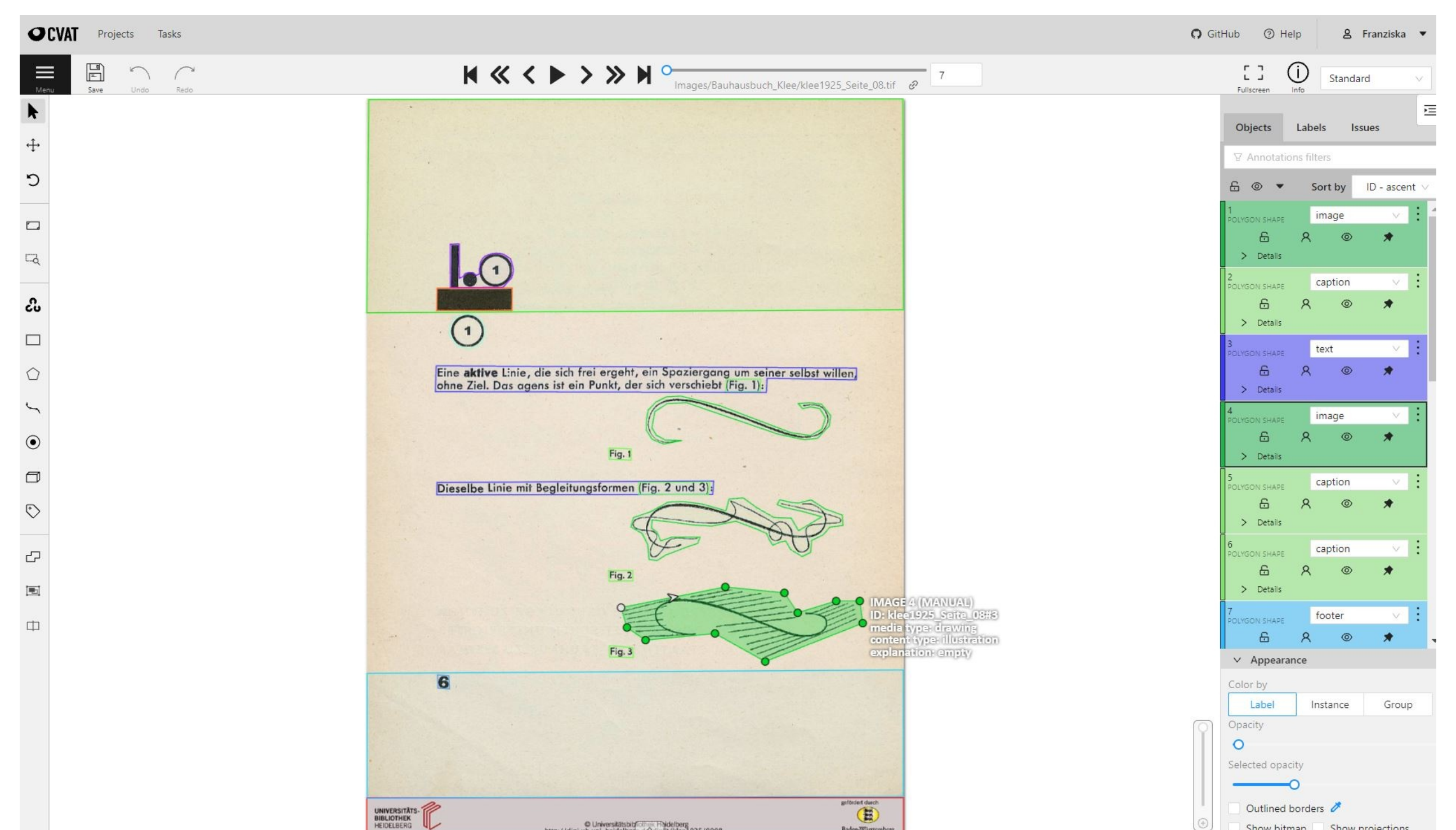
Screenshot aus dem seit Kurzem abgeschlossenen Annotationsprozess zur Layout-Analyse in CVAT.

Auf der Grundlage des erstellten Datensatzes wird in Kürze mithilfe des PubLayNet-Datensatzes (Zhong et al 2019) ein Mask R-CNN-Transferlernen (He et al 2017) für ein 19-Klassen-Problem durchgeführt. Unabhängig davon können die via CVAT annotierten Untersuchungsgegenstände als Grundlage für erste Analysen verwendet werden.